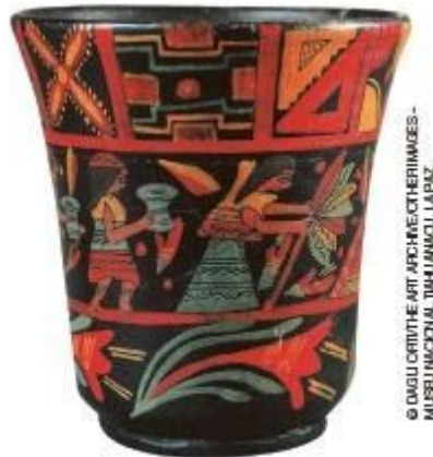
Vaso cerimonial da cultura inca.

7. Observe a imagem a seguir e faça o que se pede.